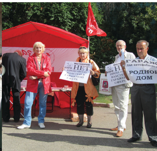
► Акция протеста против сноса гаражей