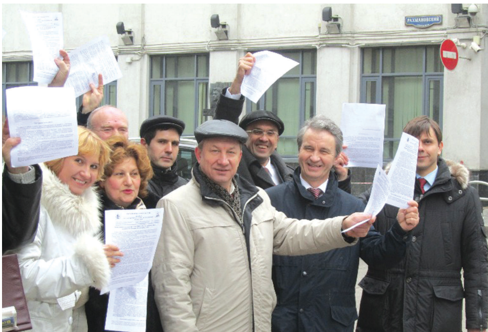
► Пикет у здания МГД за административную реформу в Москве