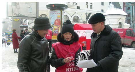
▶ Пикет фракции КПРФ в поддержку Народного референдума

Сумма прожиточного минимума, основанного на потребительской корзине образца 1 января 2005 года, то есть восьмилетней давности, не отражает реального уровня жизни столичных пенсионеров.