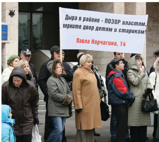
► Митинг против точечной застройки

движением «Архнадзор» выходили на акции протеста против сноса исторических зданий в центре Москвы и строительства новоделов. В 2012 году фракция приняла участие в нескольких акциях протеста против реформы образования в Москве, вредного меню в детских садах, а также в серии митингов «За честные выборы!».