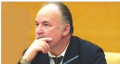
► Николай Губенко на заседании МГД

«Единая Россия» даже не дала возможности обсудить инициативу на заседании парламента.