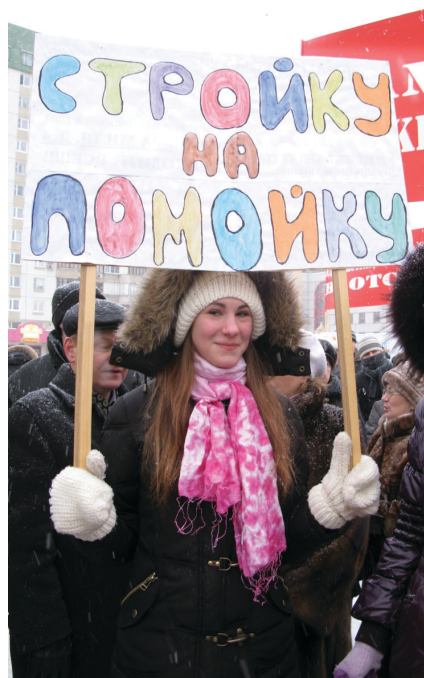
► Митинг в Жулебино против строительства оптового рынка

✓ Фракция издала 20 выпусков информационных листовок . По материалам круглого стола «Проблемы миграции в Москве. Роль государственных органов и общественных организаций» издан информационный бюллетень тиражом 10 тысяч экземпляров. По материалам научно-практической конференции «Нерешенные экологические проблемы Москвы и Подмосковья» издан сборник материалов тиражом 2000 экземпляров.