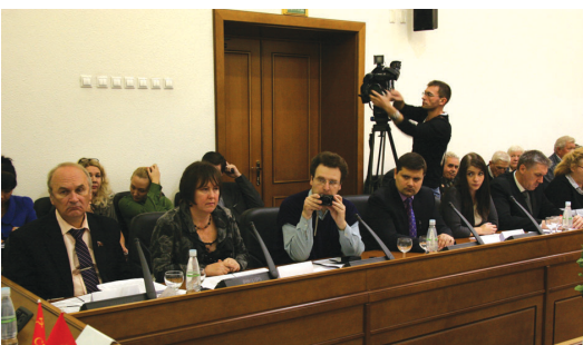
► Круглый стол по проблемам здравоохранения

✓ Проведение круглых столов по городским проблемам – это возможность собрать вместе представителей инициативных групп граждан и ответственных чиновников. Москвичи получают возможность озвучить свои проблемы и потребовать от чиновников конкретные ответы на вопросы. За три года фракция КПРФ провела 33 круглых стола по проблемам ЖКХ, экологии, здравоохранения, образования, ювенальной юстиции, миграции, обманутых дольщиков жилья, развития транспорта и другим.