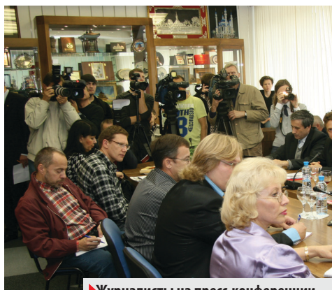
► Журналисты на пресс-конференции фракции КПРФ