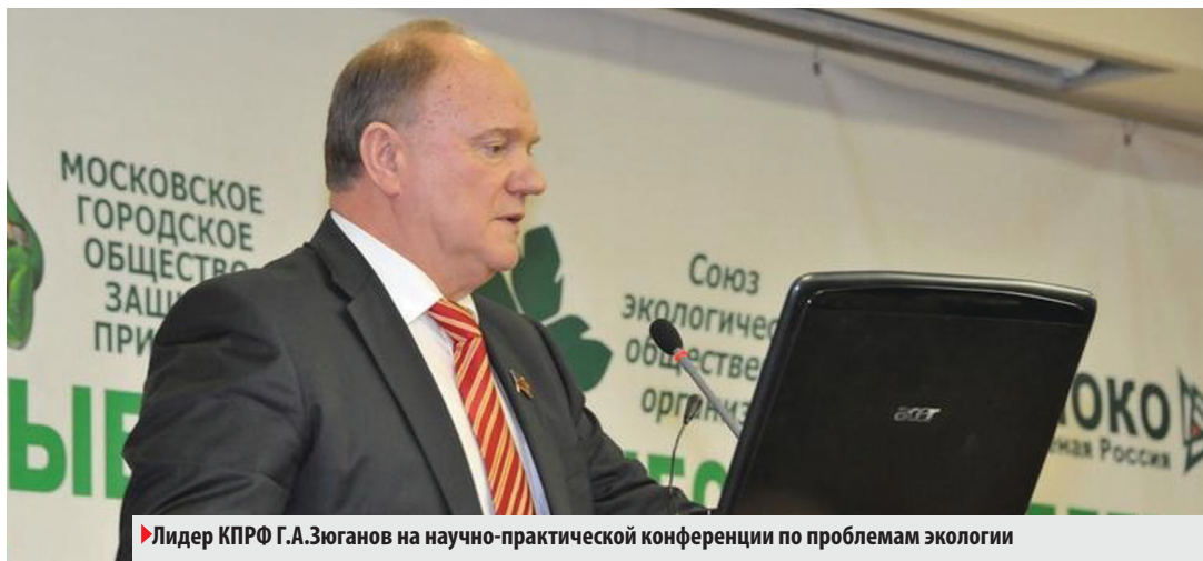
► Лидер КПРФ Г.А.Зюганов на научно-практической конференции по проблемам экологии