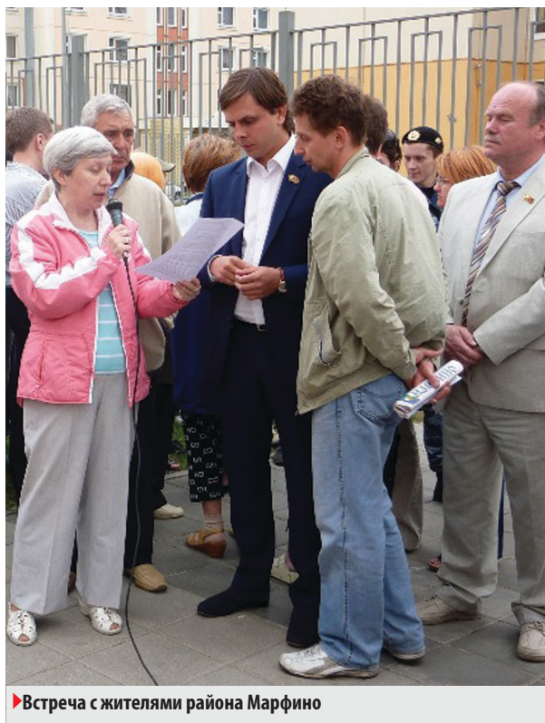
► Встреча с жителями района Марфино