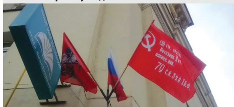
▶ 9 мая 2012 года Знамя Победы было вывешено на зданиях Москвы