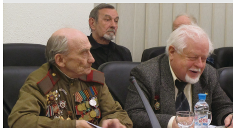
▶ Встреча с ветеранскими организациями по законопроекту о «детях войны»