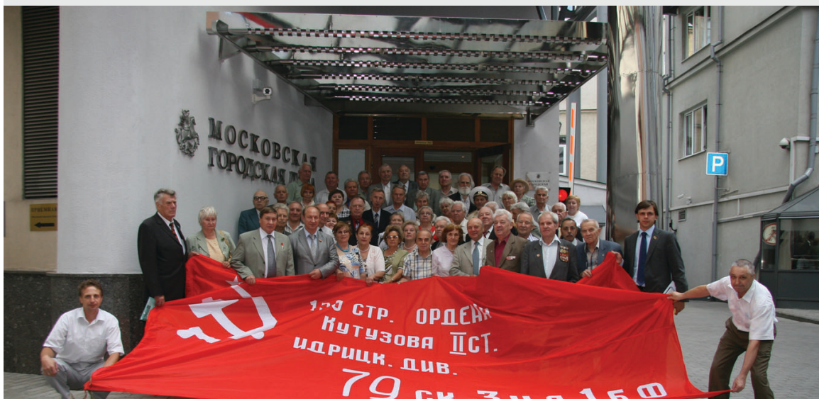
► Встреча с ветеранами по вопросу принятия закона «0 копии Знамени Победы»