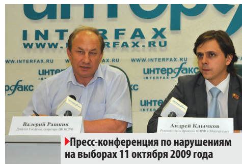
► Пресс-конференция по нарушениям на выборах 11 октября 2009 года