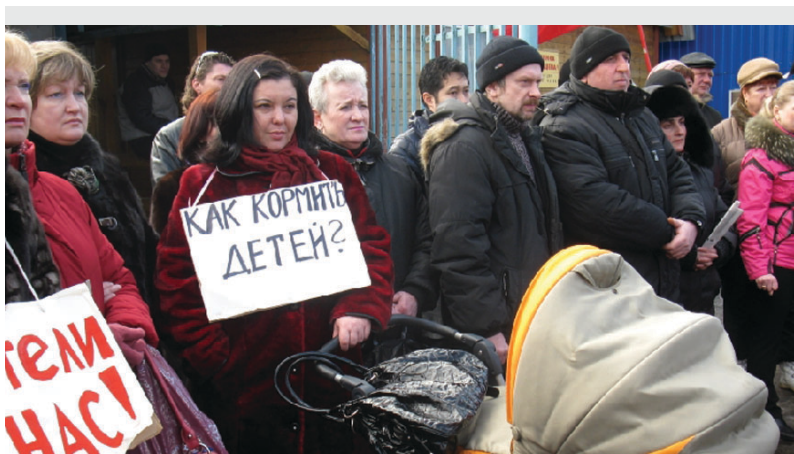
► Митинг против закрытия Красногвардейского рынка

▼ За три года депутаты КПРФ приняли 1845 избирателей , получили 17580 различных видов писем , провели 32 встречи с москвичами .