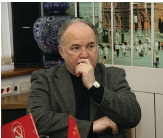
► Пресс-конференция по вопросу расширения Москвы

✓ Проведение круглых столов по городским проблемам – это возможность собрать вместе представителей инициативных групп граждан и ответственных чиновников. Москвичи получают возможность озвучить свои проблемы и потребовать от чиновников конкретные ответы на вопросы. За три года фракция КПРФ провела 33 круглых стола по проблемам ЖКХ, экологии, здравоохранения, образования, ювенальной юстиции, миграции, обманутых дольщиков жилья, развития транспорта и другим.